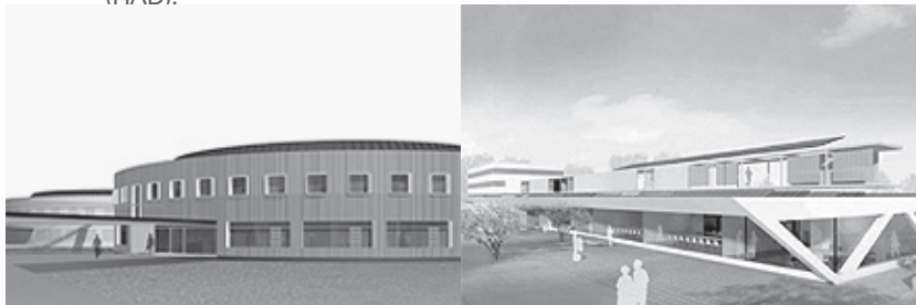
Neubau eines Büro-Passivhauses in Cölbe: 1. Preis Freitag Hartmann Sinz Architekten, Berlin, 2. Preis HHS Planer + Architekten AG, Kassel (Bild rechts)

erfolgt die öffentliche Bekanntmachung über die Tages- oder Fachpresse, oberhalb eines Honorarwerts von 80.000 € über die Hessische Ausschreibungsdatenbank (HAD).